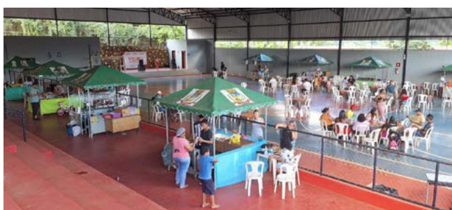
Nos dias em que há previsão de chuva, a mostra é realizada na quadra da escola de Pinheiros

Se participou das últimas edições da Mostra Sabores & Artes de Pinheiros , você já está sabendo que estamos fazendo o evento na quadra da Escola Municipal Dona Balbina Antunes Penido.