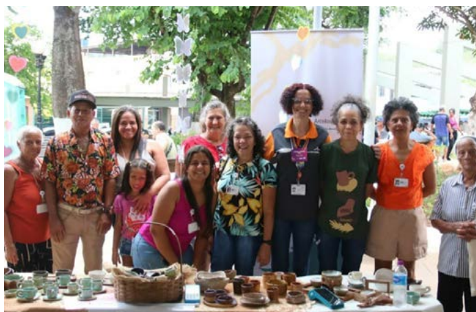
A primeira feira cultural e literária de Itatiaiuçu foi realizada com apoio da ArcelorMittal

O público ainda se encantou com as danças do Grupo Integrar-te e do projeto Lá Da Favelinha , que trouxeram muita energia com coreografias inspiradas no Tik Tok. O dia foi completo com a feira ao ar livre, que teve participação de três expositores da Mostra Sabores & Artes de Pinheiros , além de doação de mudas e até um cantinho da leitura.