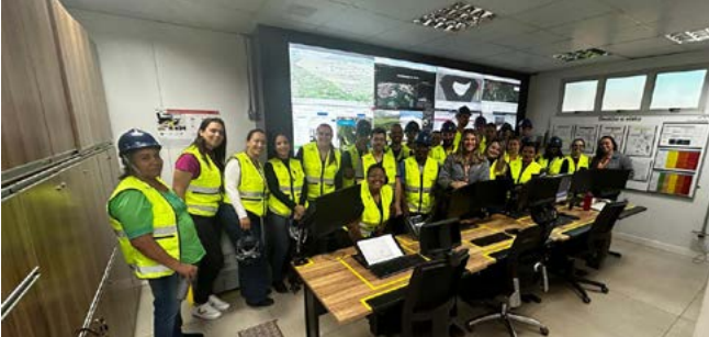
O Programa de Visitas da ArcelorMittal em 2024 foi um sucesso

Durante o ano de 2024, ArcelorMittal e comunidade estiveram ainda mais próximos. Por meio do Programa de Visitas , 66 moradores de Pinheiros e região puderam conhecer de perto a unidade de Serra Azul.