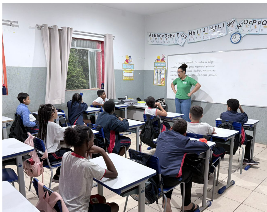
Projeto "Água é Vida" aconteceu na Escola Municipal João Gomes Ferreira, em Vieiras

E esse cuidado não fica só dentro da operação. A ideia sempre foi levar esse conhecimento também para a comunidade , incentivando práticas simples que fazem diferença no dia a dia.